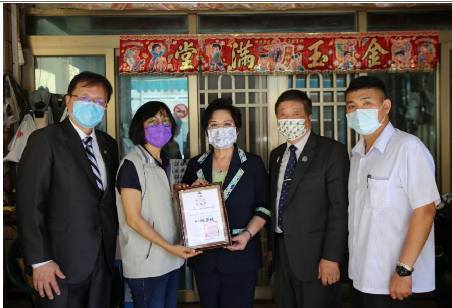
◎台南市社會局致贈感謝狀