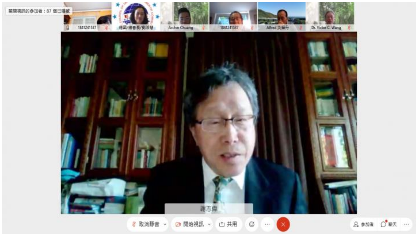
◎駐德國代表處謝大使志偉感謝海外僑胞的努力與用心