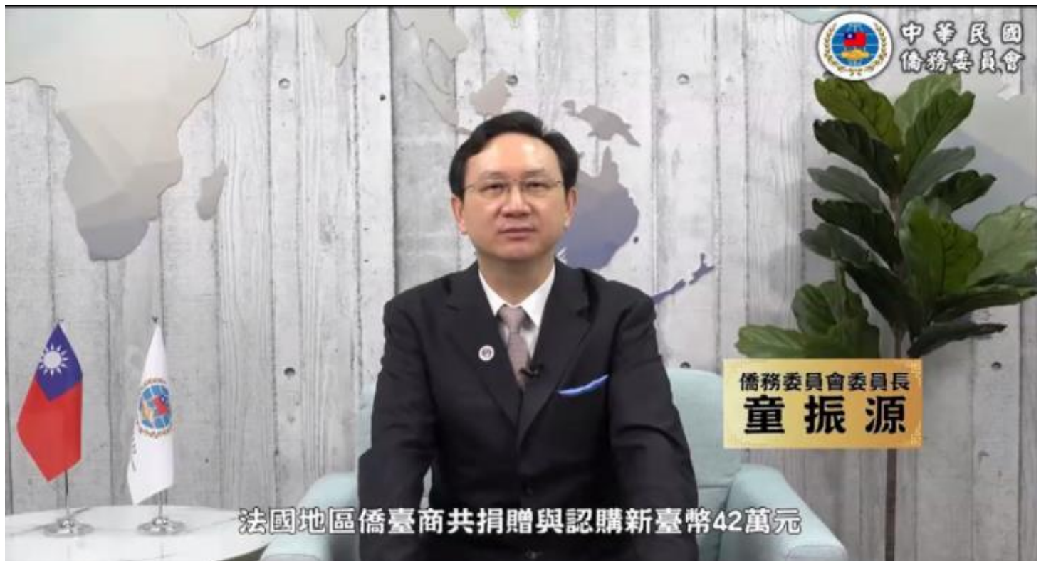
◎僑務委員會童委員長感謝歐洲台商們對臺灣的支持與愛護